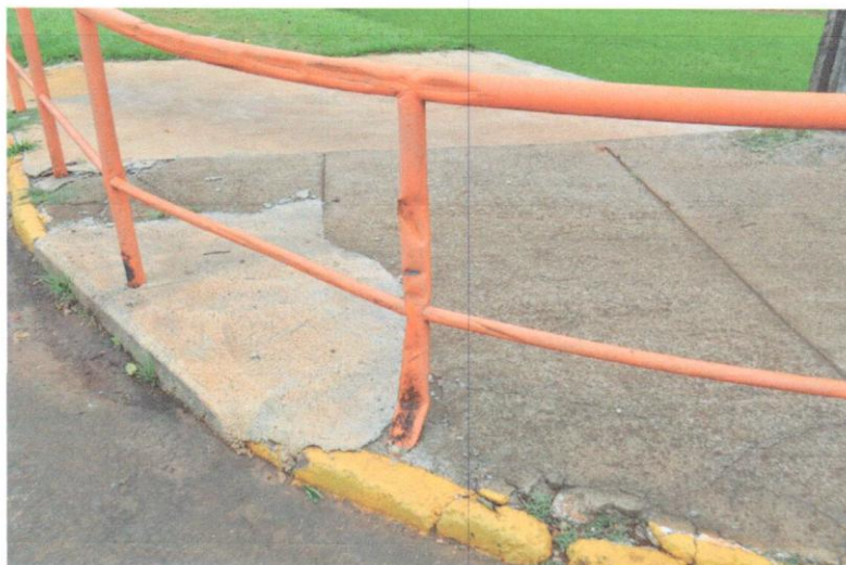
3- Esquina sacolão das frutas