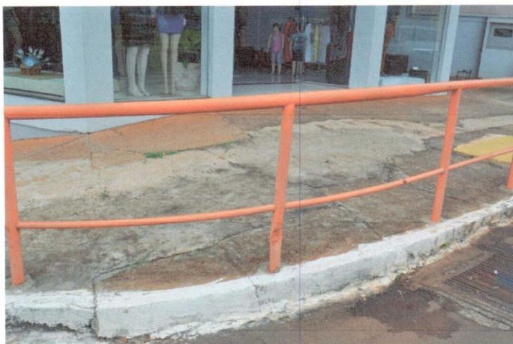
2-esquina Diversita/perto feicap