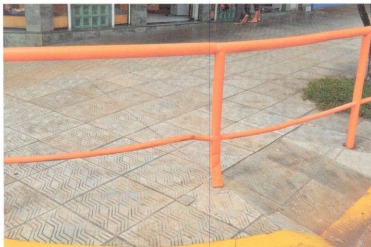
1- Esquina relojaria próximo a praça da bandeira

Deverão ser substituídas as partes dos tubos comprometidas com o mesmo diâmetro e qualidade da existente, executada solda de modo a não deixar nenhuma saliência ou aresta e deverá ser repintada a parte substituída com cor igual a existente.