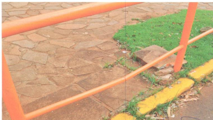
9-Praça Reneu Mertz