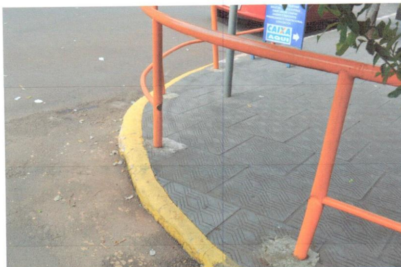
6-Esquina Pedrinho Nidermaier

LICITAÇÃO N.º 100/2018 CARTA CONVITE N. 15/2018 TIPO: MENOR PREÇO GLOBAL