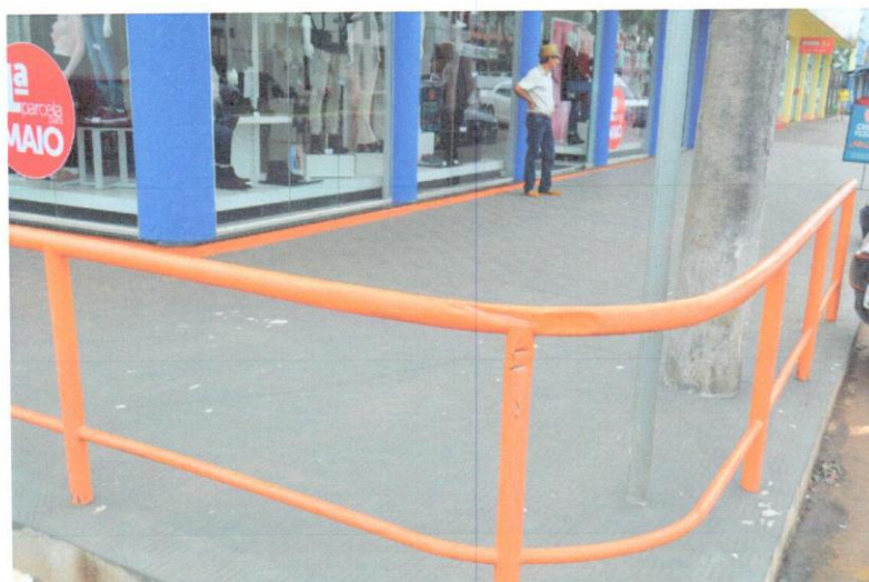
7-Esquina Lojas Três Passos