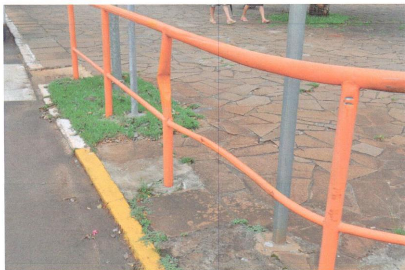
5-Praça Reneu Mertz