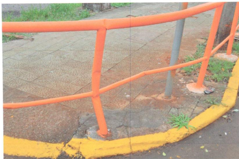
4-Esquina da mexa-se