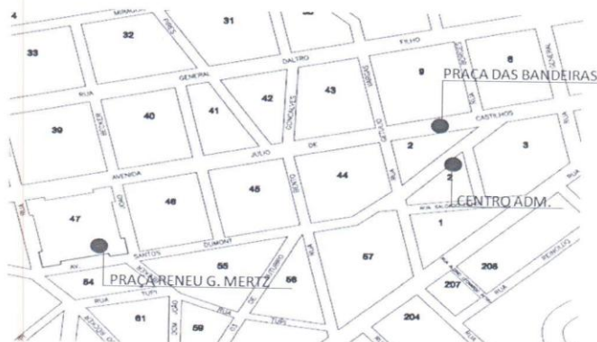
Figura 1 - Mapa da localização dos Parklet

A empresa vencedora da licitação deverá apresentar ART de responsabilidade técnica sobre a execução de todos os serviços da planilha orçamentária.