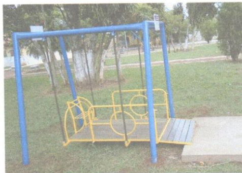
Figura 2 - Imagem meramente ilustrativa

- 01 balanço infantil adaptado para cadeirante, medindo 1,80 x 2,00m, com quatro pés em ferro 3" #14, estrutura do balanço em tubo de 1" #14; rampa e assoalho em madeira de lei, para subida da cadeira de rodas com travas, impedindo o movimento da cadeira; um assento para acompanhante. Sistema de movimentação com buchas de poliacetal 40 mm; Estrutura galvanizada com pintura eletrostática.