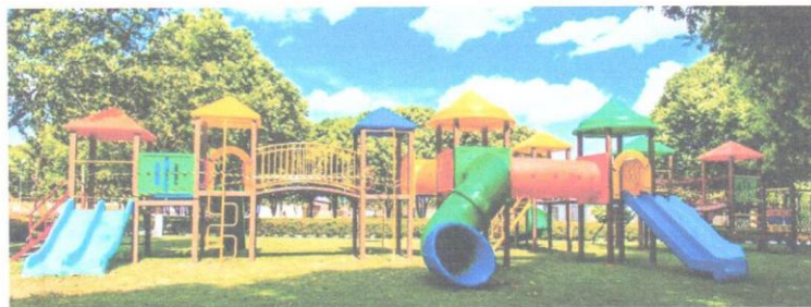
Figura 1 - Imagem meramente ilustrativa

- 01 conjunto de jogo da velha colorido com 09 cilindros em polietileno rotomoldado com as letras X e O na cor preta.