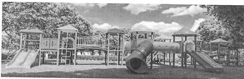
Figura 1 - Imagem meramente ilustrativa